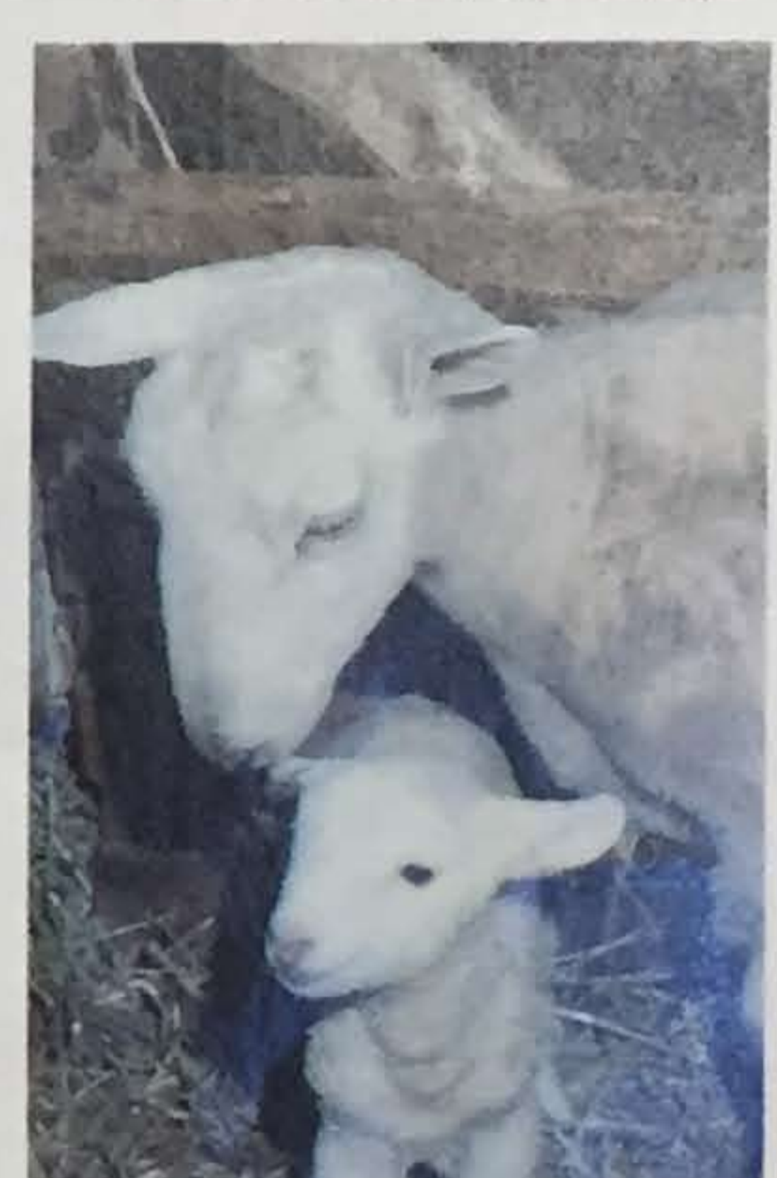
L'amour maternel, ça ne se remplace pas!

« À l'époque, indique-t-elle, l'agneau que l'on trouvait dans nos boucheries provenait de l'Ouest. Les fournisseurs étaient d'importantes compagnies, spé-