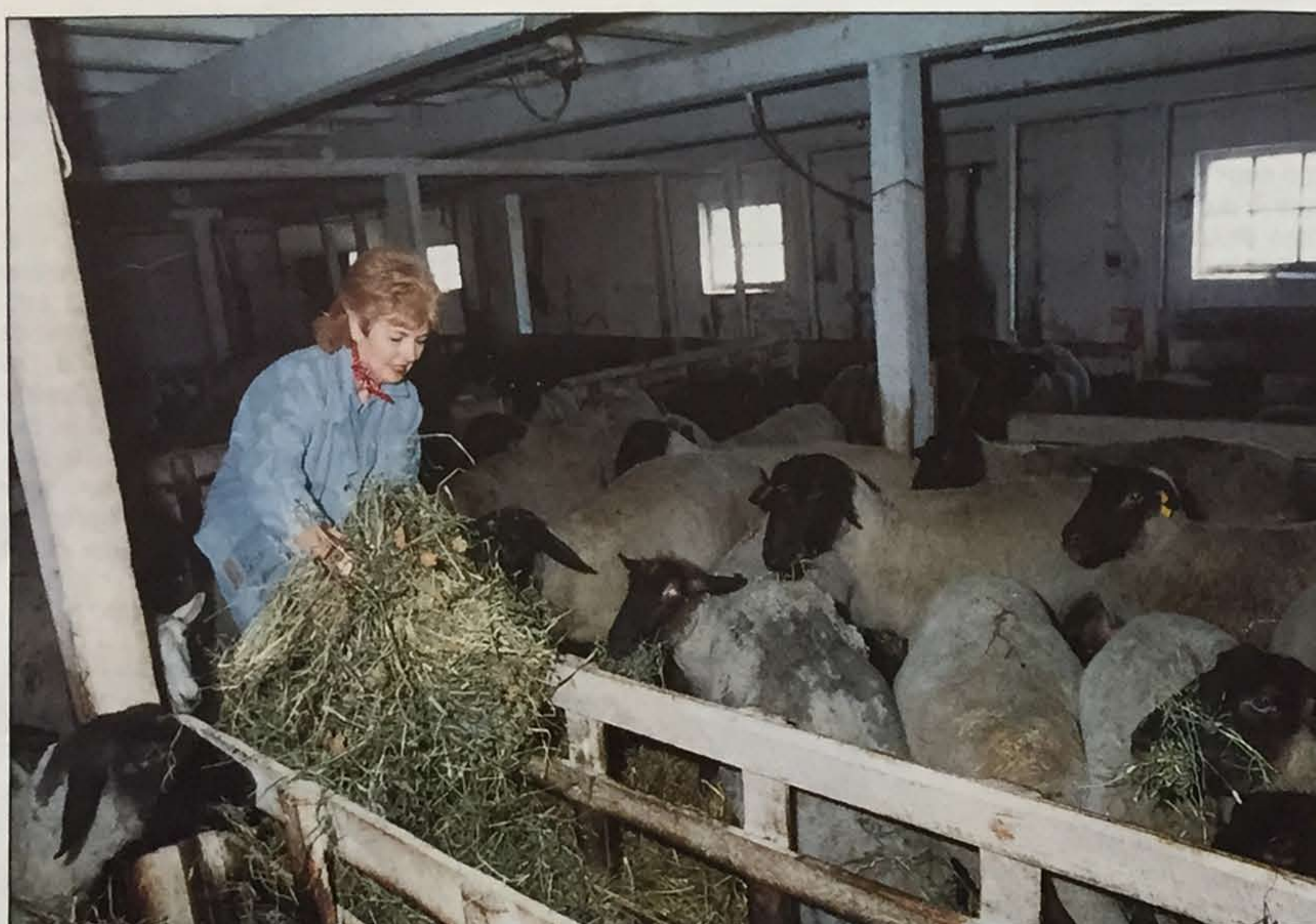
L'œil du maître fait engraisser les bêtes.