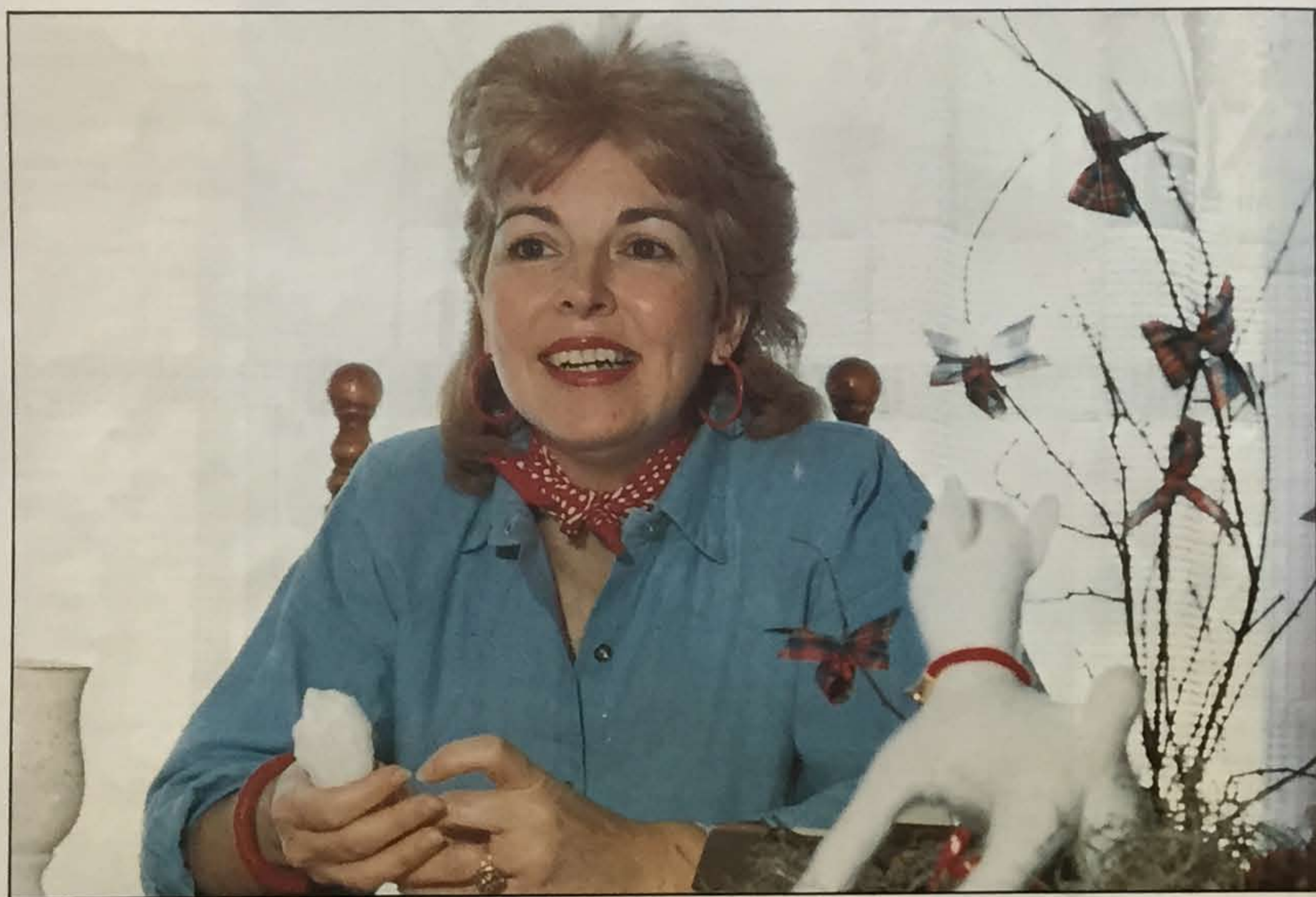
Du dynamisme et du charme!